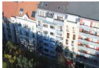
Lumírova Praha 4 3+kk | pronájem