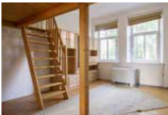
V Nových Vokovicích Praha 6 1+1 | pronájem