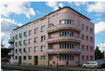
Dvorecké náměstí Praha 4 3+1 | prodej