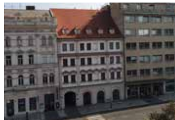
Karlovo náměstí Praha 2 3+kk | prodej