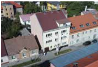
Ďáblická Praha 8 2+kk | prodej