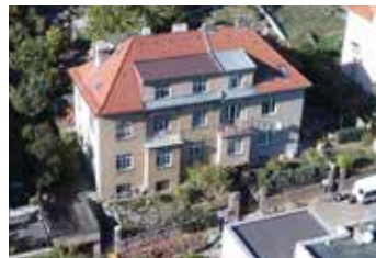
Nad Obcí Praha 4 3+1 | prodej