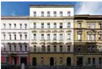
Bořivojova Praha 3 2+1 | prodej