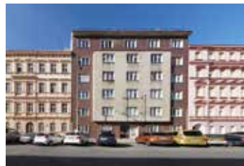
Peckova Praha 8 sklad | prodej