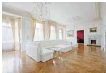
Polská Praha 2 5+1 | prodej