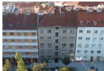
Ruská Praha 10 3+1 | prodej