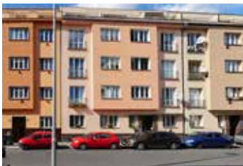
U Hranic Praha 10 2+kk | prodej